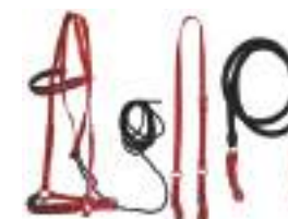
Aperos y correajes de monturas